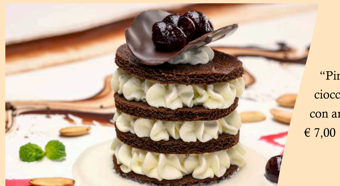
"Pinguino" panna e cioccolato con amarene e mandorle € 7,00