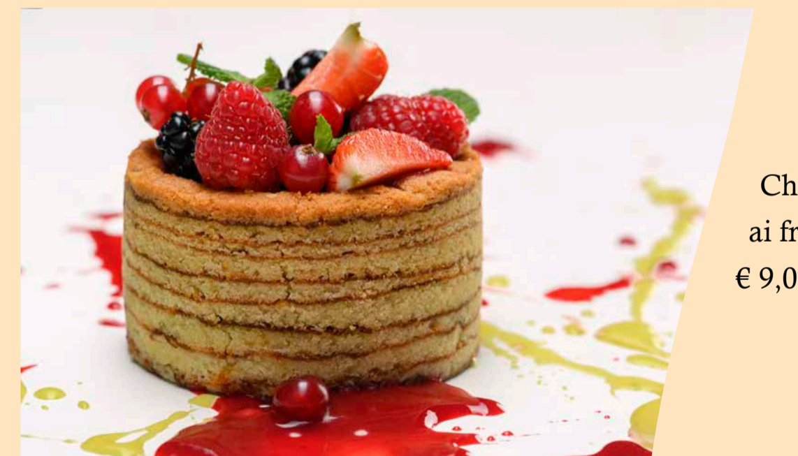
Charlotte ai frutti rossi € 9,00