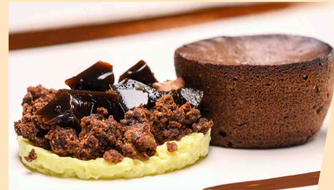
Tortino caldo al cioccolato fondente, cremoso all'arancia e cardamomo, biscotto alle noci e gelatina al caffè € 9,00