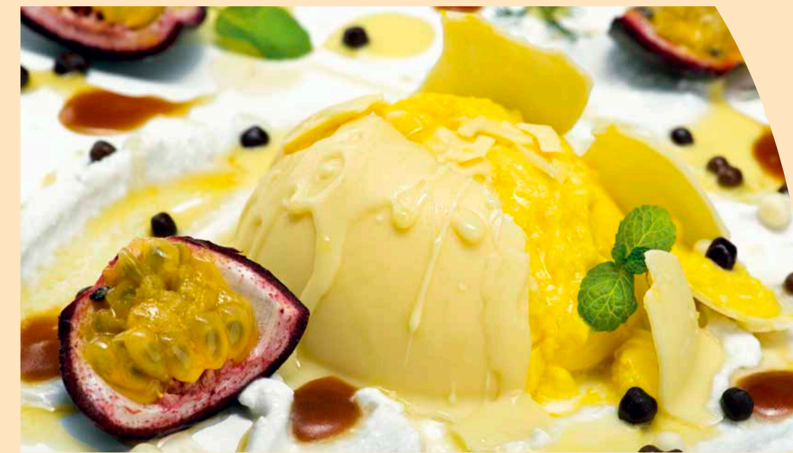
Crema cotta al cioccolato bianco frutto della passione e noce di cocco € 9,00

Con abbinamento di grappa Le Diciotto Lune di Marzadro € 10,00