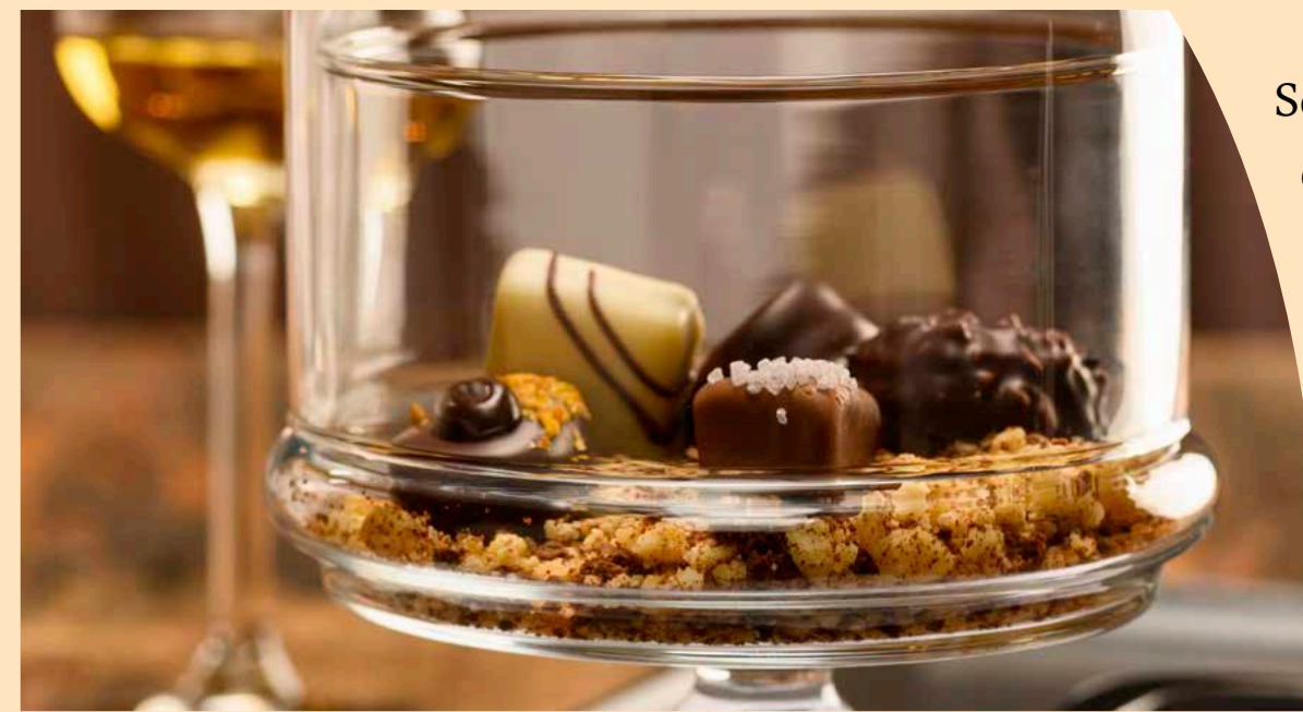
Selezione di cioccolatini € 8,00