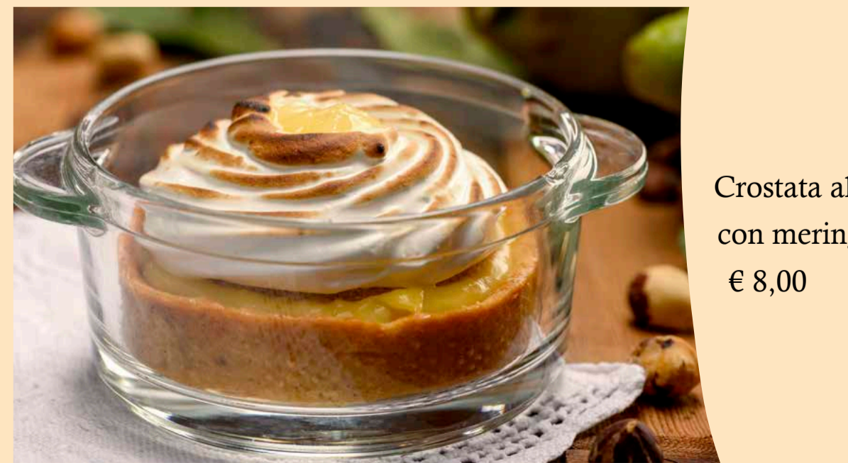
Crostatina al limone con meringa € 8,00