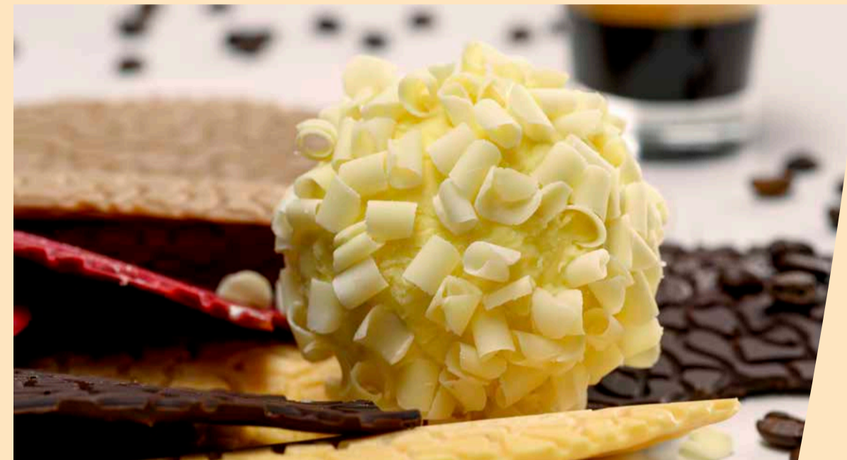
Tartufo ai gusti: crema, nocciola e pistacchio in crosta di cioccolato bianco e caffè espresso € 8,00