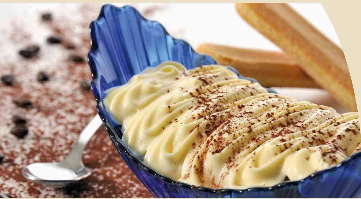
Tiramisù della casa € 6,00