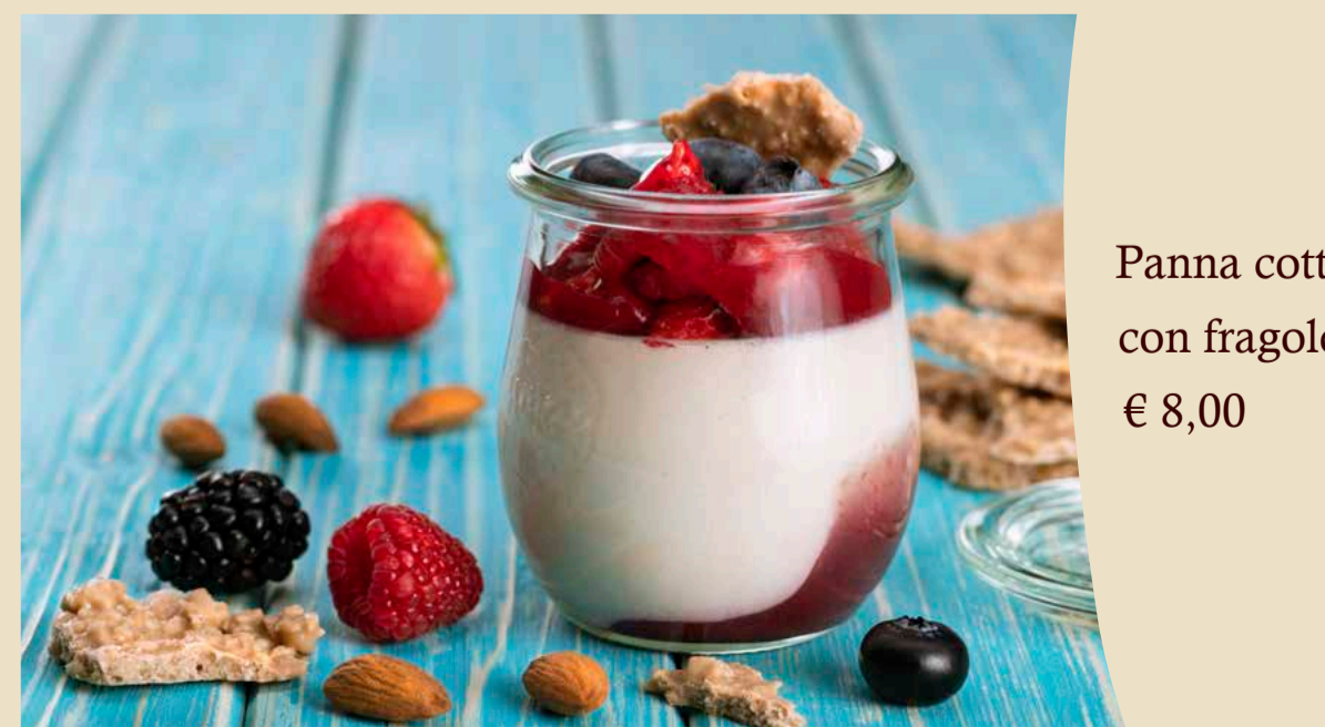
Panna cotta alle mandorle con fragole e frutti di bosco € 8,00