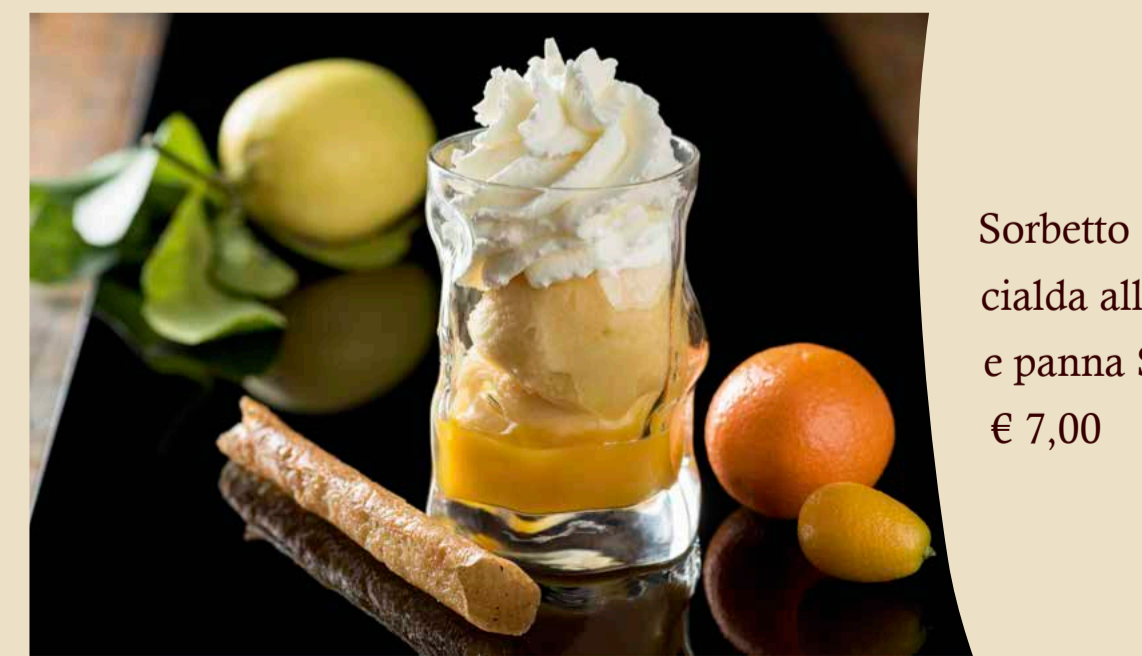
Sorbetto agli agrumi e gin, cialda allo zenzero e panna Schweppes € 7,00