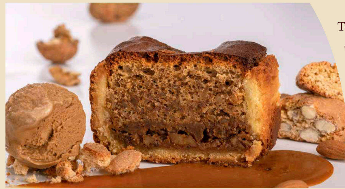
Torta di noci con salsa al caramello, gelato gusto caffè e cantucci € 8,00

Con degustazione di Grappa del Trentino € 9,00