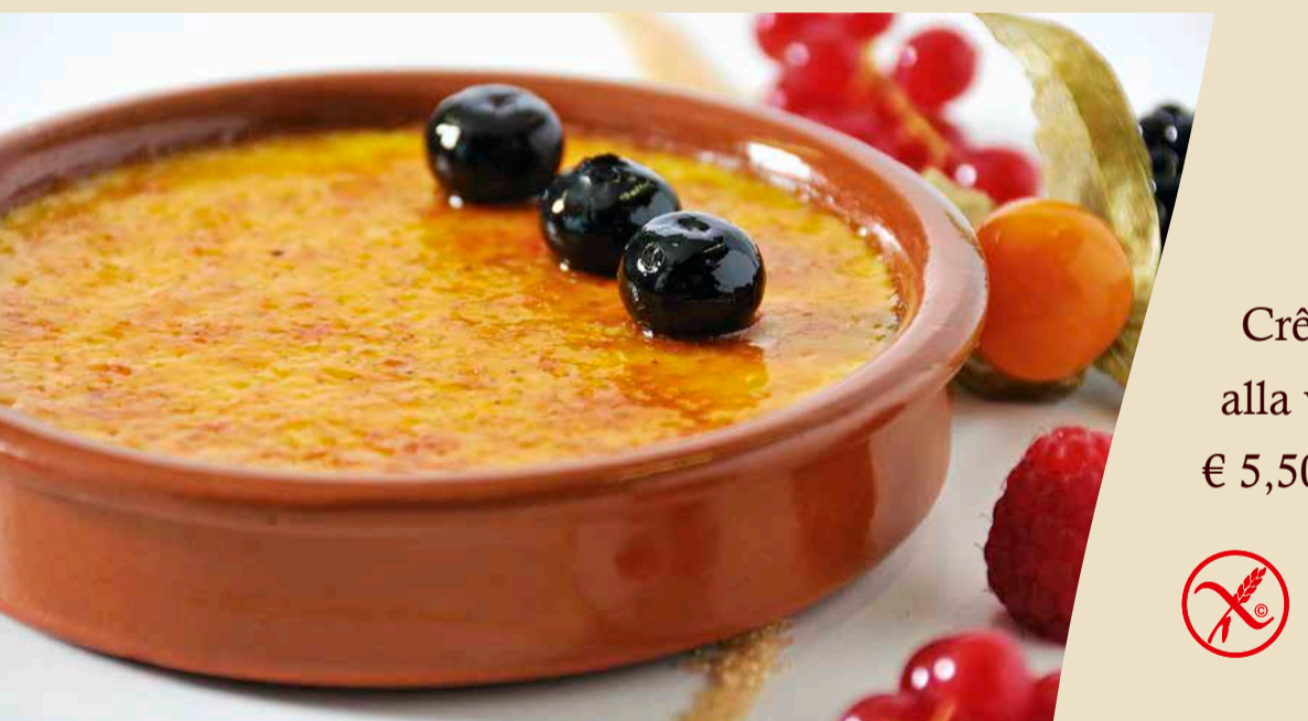
Crème Brûlée alla vaniglia € 5,50