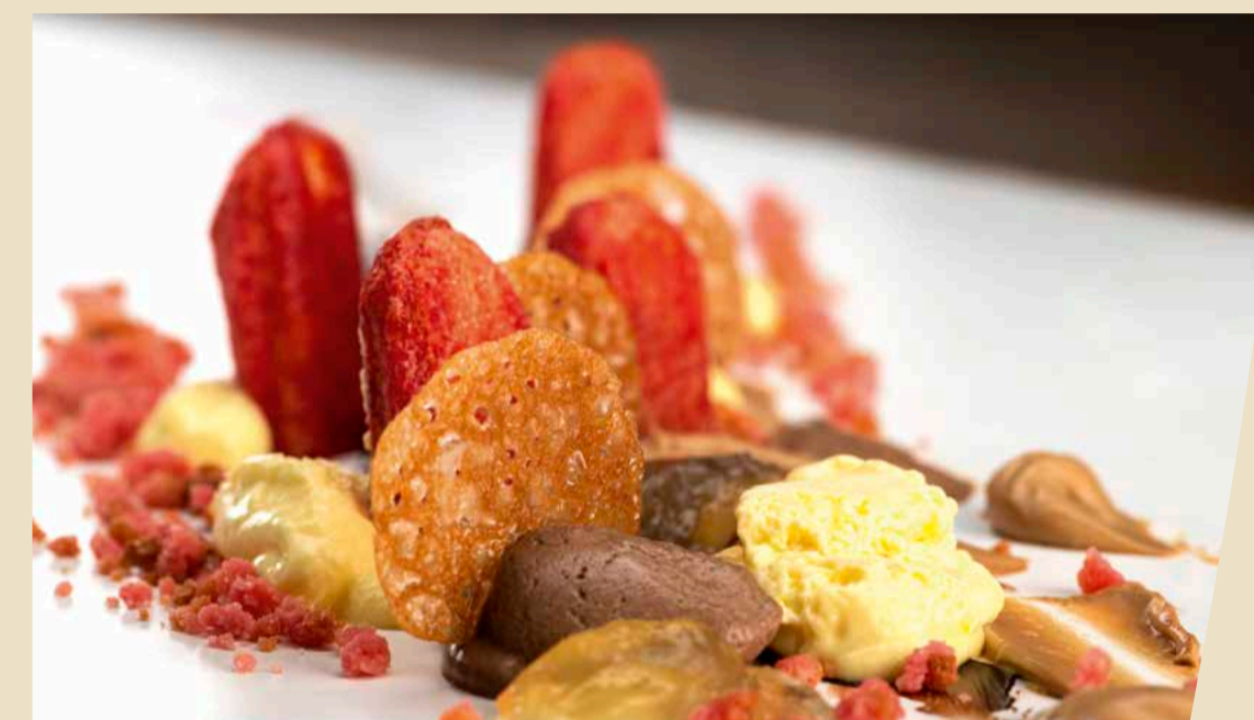
“Zuppa Inglese Le Giare 2019” € 7,50

Con degustazione di Grappa del Trentino € 9,00