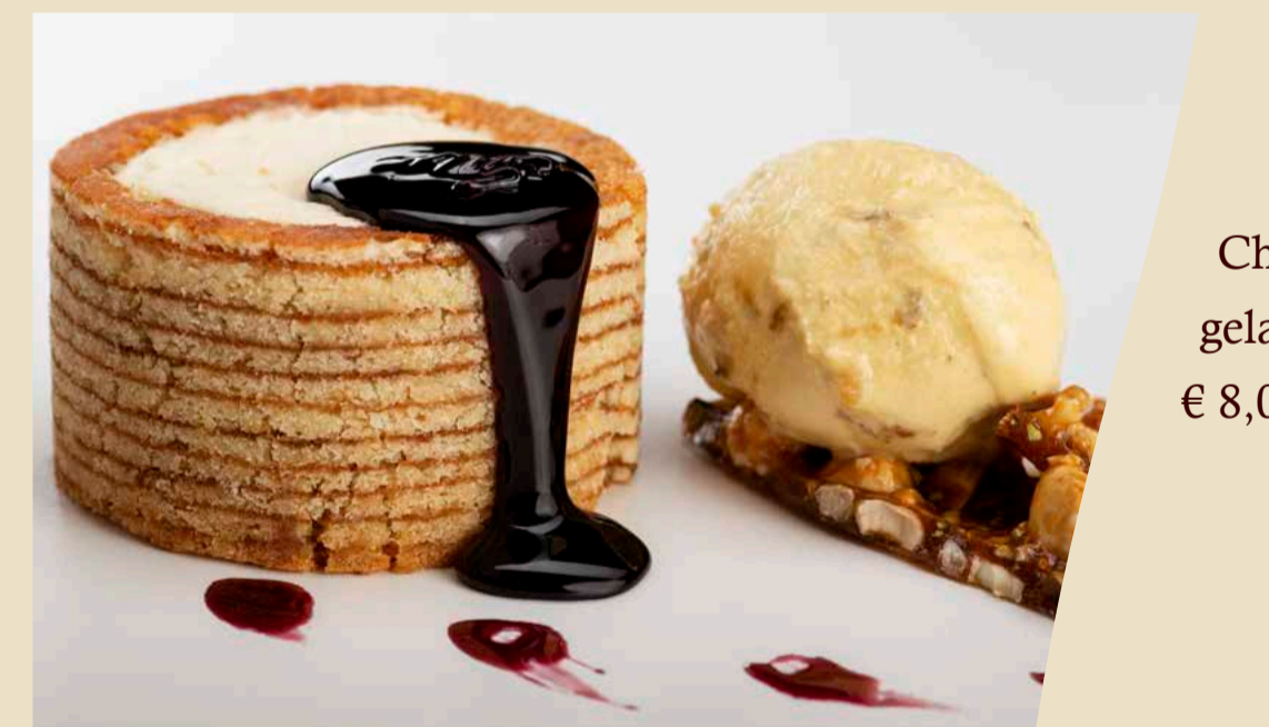
Charlotte al vino cotto e gelato gusto croccantino € 8,00