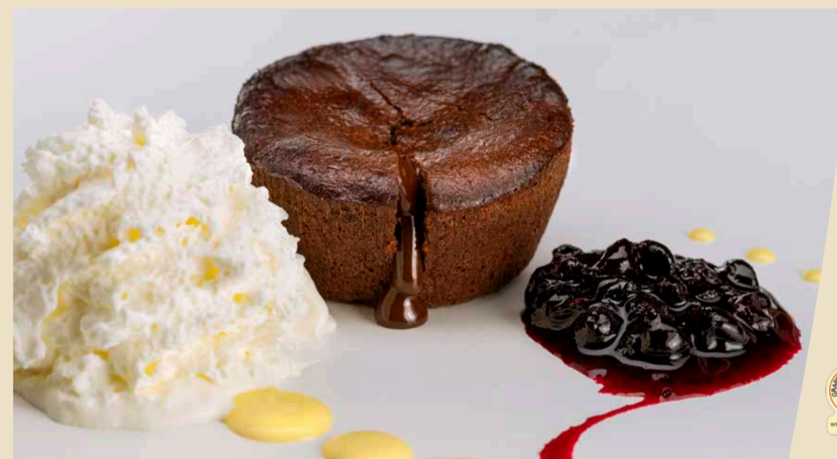
Tortino caldo al cioccolato fondente, confettura di ribes nero e panna montata € 8,00

Con degustazione di Grappa del Trentino € 9,00