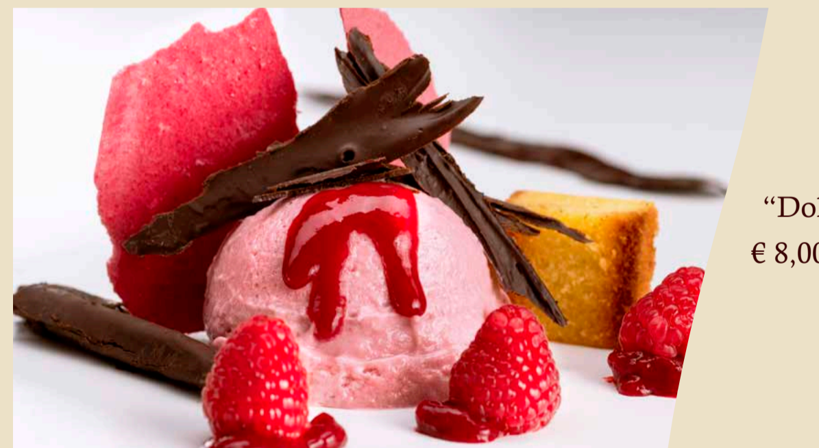
“Dolce Lamponi” € 8,00