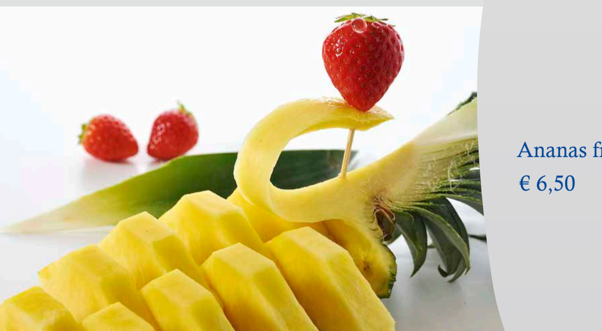
Ananas fresco € 6,50