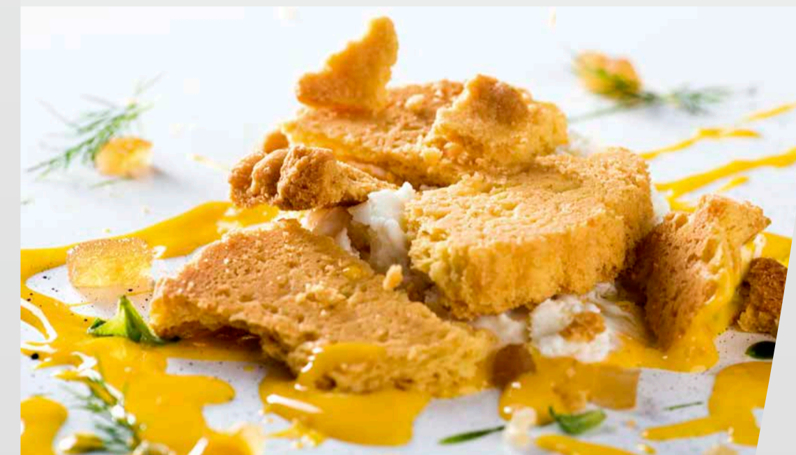
... Mi è caduta la crostata... gelato all'erba limone, zabaione al limoncello con frolla € 8,00