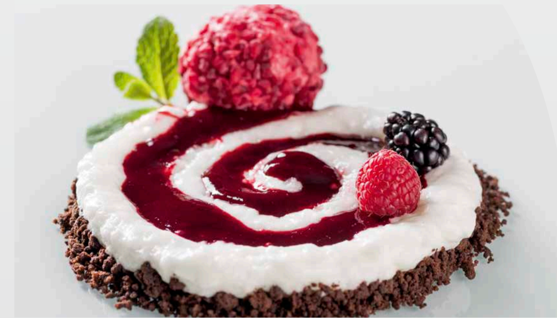
Meringa al limone, biscotto al cioccolato, purea di more e sorbetto al lampone € 7,00