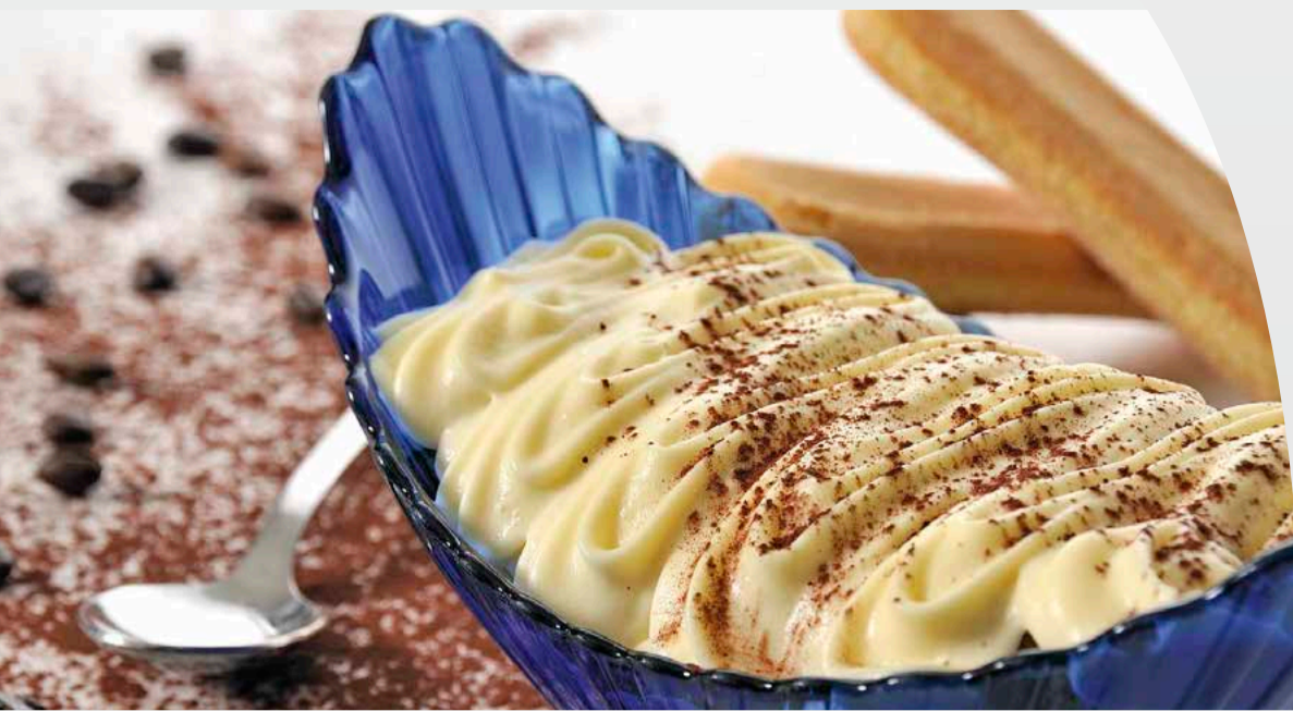
Tiramisù della casa € 6,00