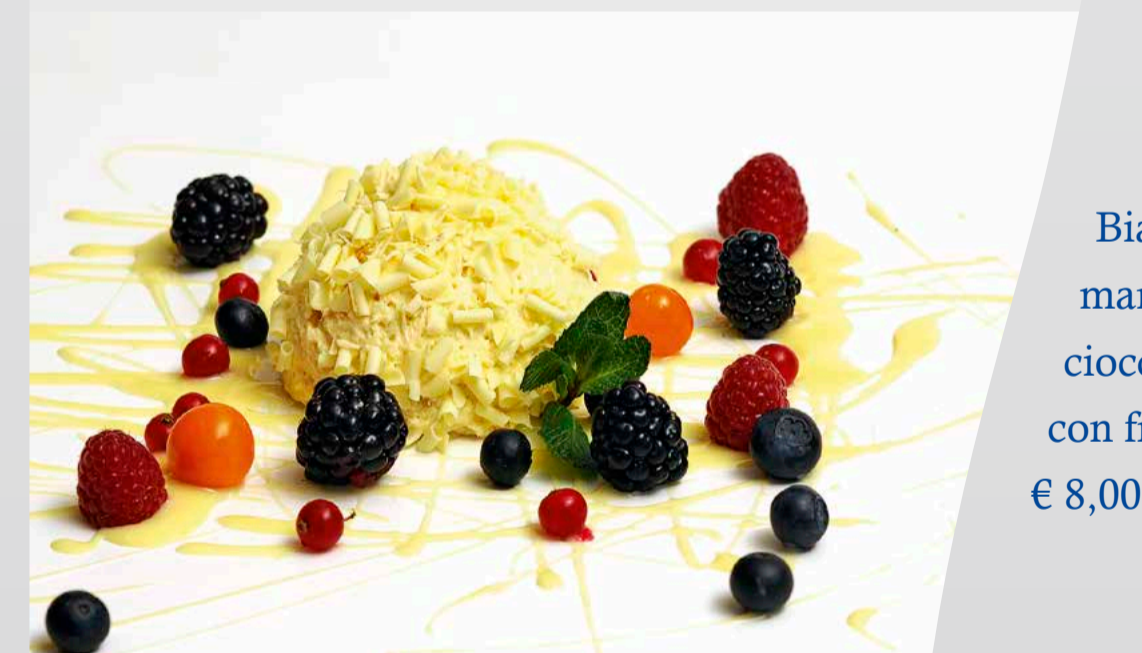
Bianco mangiare alle mandorle in crosta di cioccolato bianco con frutti di bosco € 8,00