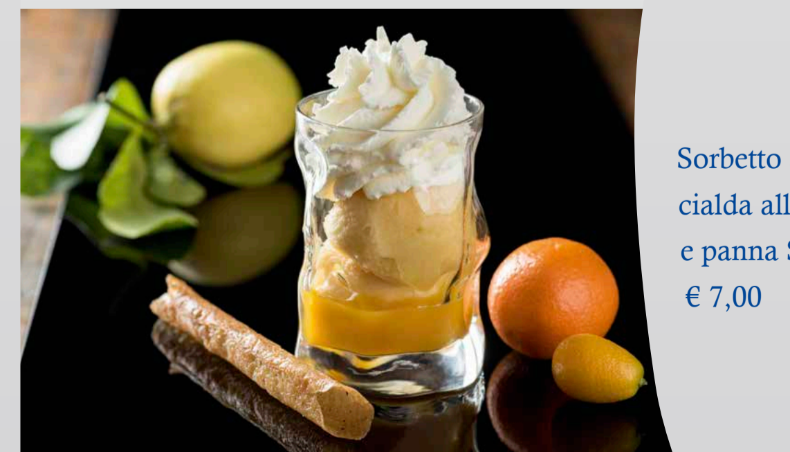
Sorbetto agli agrumi e gin, cialda allo zenzero e panna Schweppes € 7,00