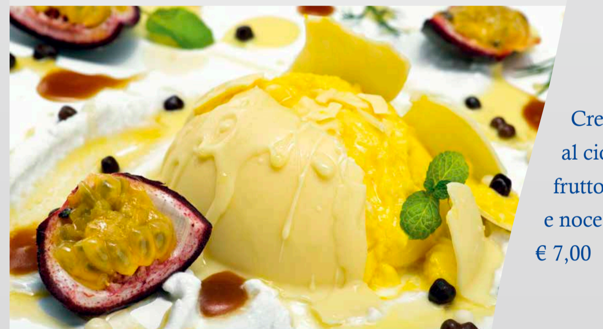
Crema cotta al cioccolato bianco, frutto della passione e noce di cocco € 7,00