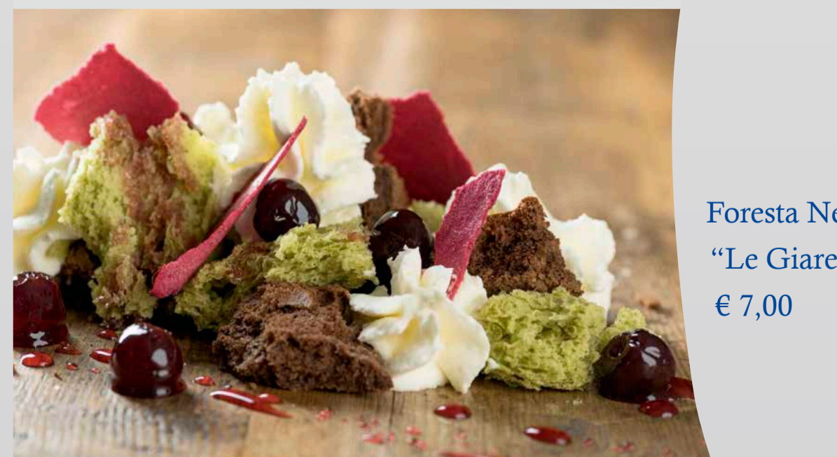
Foresta Nera "Le Giare" € 7,00