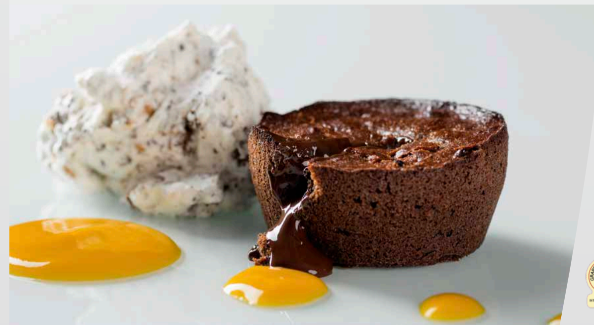
Tortino caldo al cioccolato fondente, panna montata, con mandorle e nocciole e purea di mango € 8,00