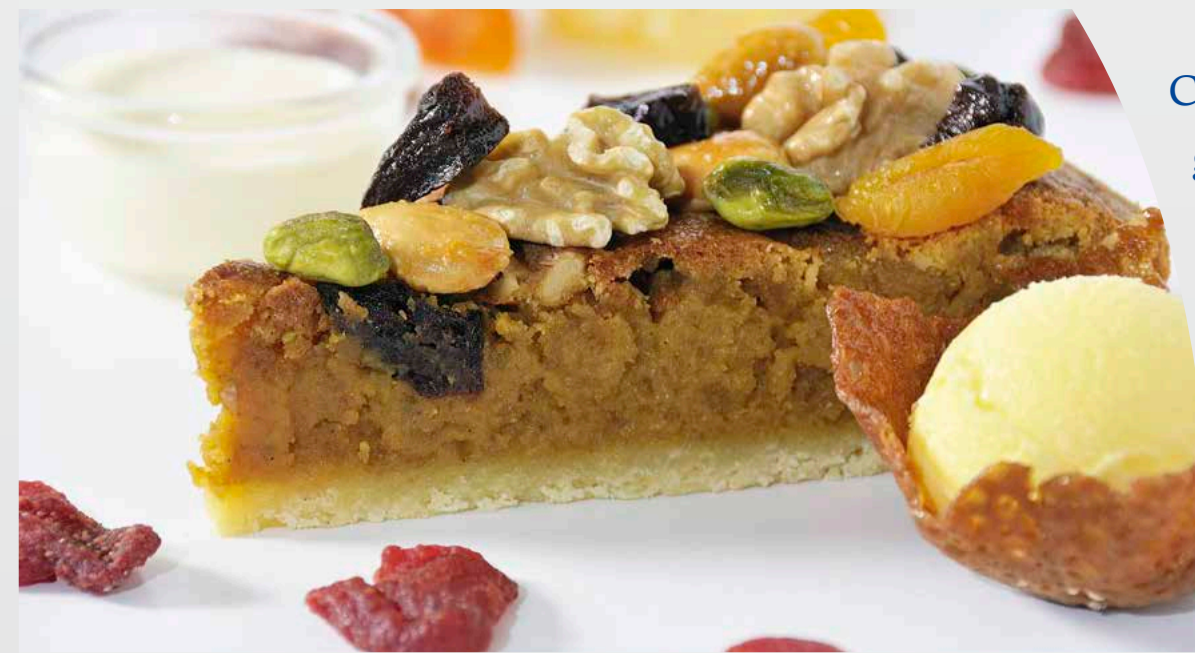
Crostata di frutta secca, gelato al cioccolato bianco e panna montata € 8,00