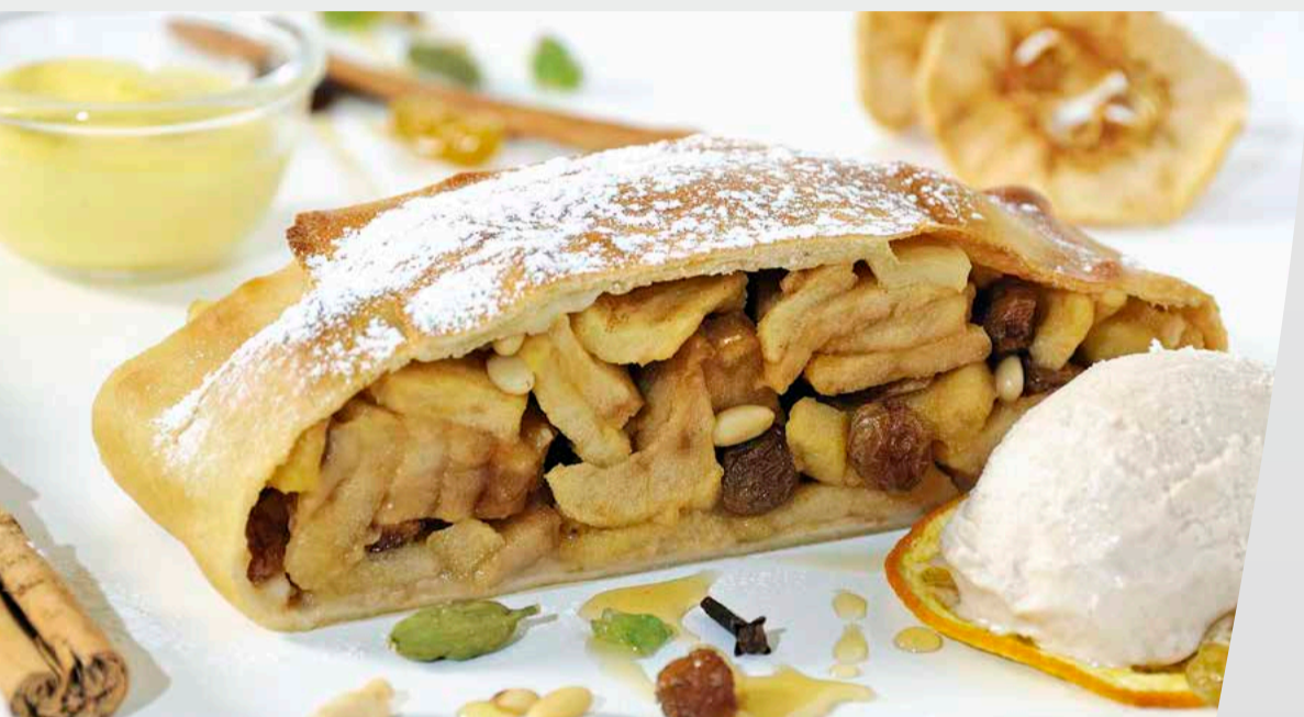
Strudel di mele con salsa alla vaniglia e gelato alla cannella € 7,00